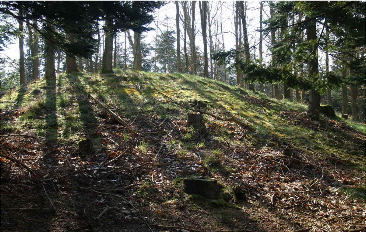
Den sydligste af de tre høje fra bronzealder eller ældre jernalder i ædelgranplantning. Den er 12 x 12 x 4 m.

Fredningsnummer Sognebeskrivelse 020611-29 a