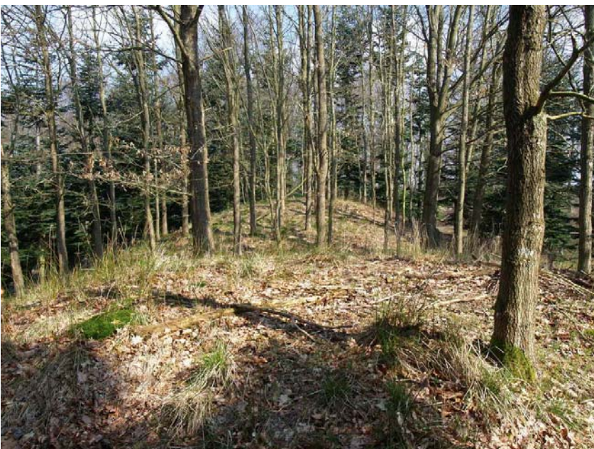
Sydhøjen med den mellemste høj i baggrunden